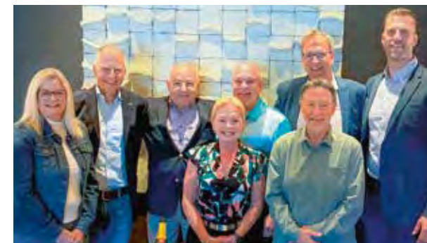
Deutsches und Amerikanisches Team feiern Verabschiedung

Wir danken ihm herzlich für seinen Einsatz und wünschen für den neuen Lebensabschnitt alles Gute, Gesundheit und viele erfüllte Momente!