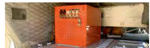
Innenraum eines DLR BO 105 mit Messgerät

Die neue Bodenplatte im Frachtraum und das Mess-Rack sind bereits installiert. Die Funktionsprüfungen sowie die Tests zur elektromagnetischen Verträglichkeit sind erfolgreich abgeschlossen. Nun ist die Rotormessanlage fertigzustellen und gemeinsam mit DLR-Piloten in Flugversuchen zu erproben,