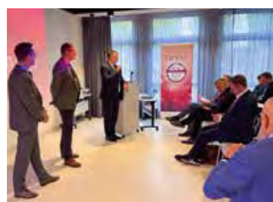
Moderatoren der Communication Days