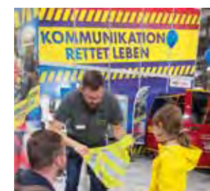
Unsere jüngsten Werbeträger