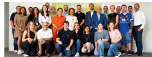
Team am Standort Bad Homburg

Zum Start fand ein Welcome-Mitarbeiterevent statt. Ziel war