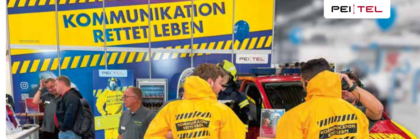
pei tel Messestand auf der FLORIAN Messe in Dresden