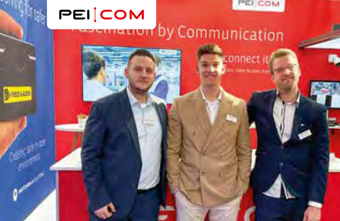
Das peicom-Team auf der EuroCIS 2025