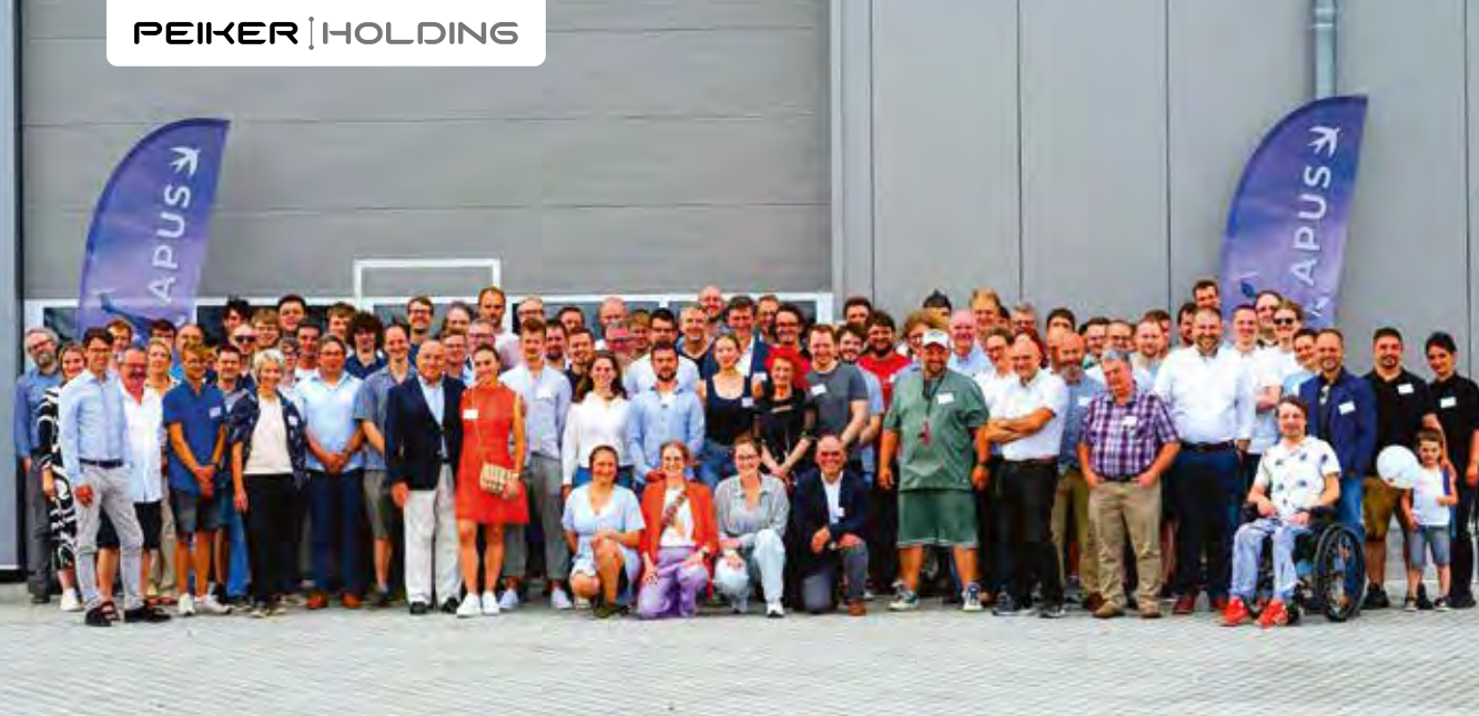
FTI und APUS sind eins

auch, wie eng die operativen Gesellschaften des Unternehmensverbands der Unternehmen der Familie Peiker zusammenarbeiten, wenn es darum geht, Potenziale zu erkennen