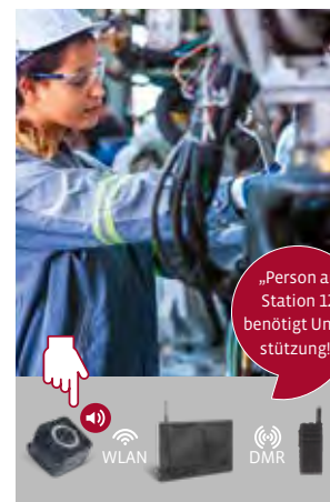
Smarte Vernetzung von Mensch und Maschine im industriellen Umfeld

Das übergeordnete Ziel ist es, perfekt funktionierende ECO-Systeme mit smarten Kommunikationslösungen anzubieten, welche den heutigen Herausforderungen zur Digitalisierung und Integration in den industriellen und behördlichen Anwendungen gewachsen sind.