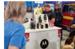
Funkgeräte und Bodycams

Für entsprechende Außenwirkung sorgte vor allem der Auftritt der in gelben Schutzanzügen gekleideten Promotoren. Ebenso für Aufsehen sorgten die Kinder der Messebesucher, die in der Malecke kreativ waren. Sie trugen stolz eine Warnweste mit dem Schriftzug „Kommunikation rettet Leben“ durch die Hallen, die sie anschließend mit nach Hause nahmen.