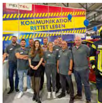
Messteam der FLORIAN

Um Missverständnisse zu vermeiden und die Einsatzbereit-