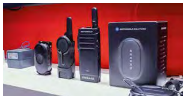
peiPRESS und Funklösungen von Motorola Solutions

Das Fazit fällt positiv aus: Die Vielzahl interessierter Besucherinnen und Besucher sowie zahlreiche neue Kontakte sprechen für einen erfolgreichen Auftritt der peicom auf der EuroCIS 2025.