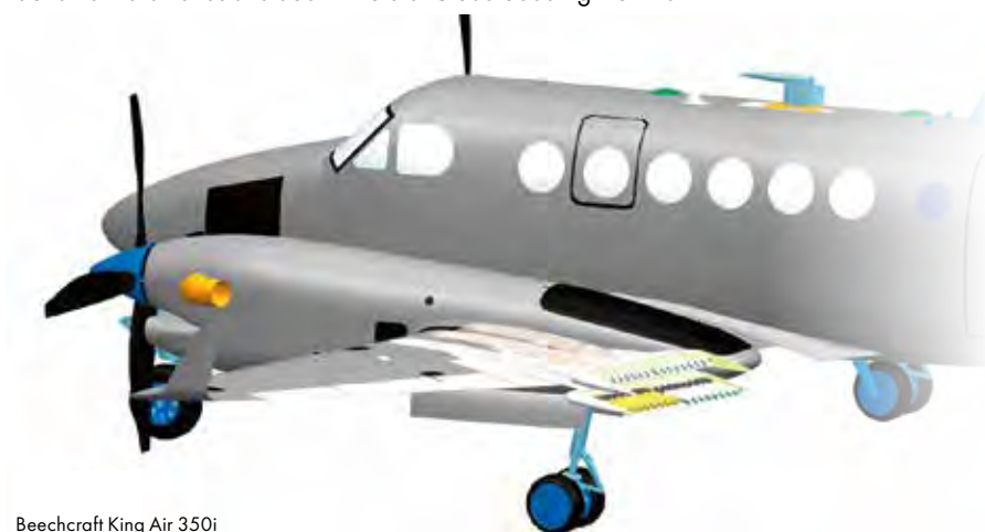
Beechcraft King Air 350i

Das Projektteam ist überzeugt, dass diese Lösung weit über Pilotprojekte hinaus Anwendung finden wird. Künftig könnte eine Serienproduktion aufgebaut werden, um der wachsenden Nachfrage nach effektiven und verantwortungsvoll eingesetzten Wettermodifikationssystemen zu begegnen.