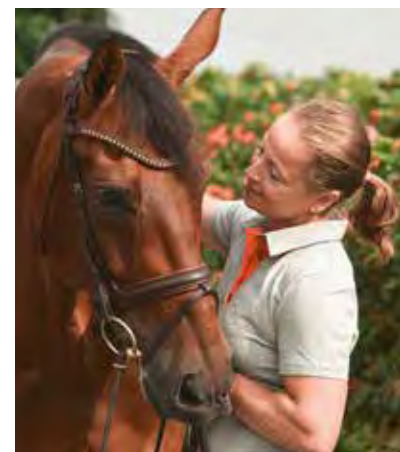
Isabell Werth, CEECOACH-Markenbotschafterin

direkt ans Innenohr. Dabei werden Audiosignale in feine Vibrationen umgewandelt, die durch Weichteilgewebe über das Schläfenbein zur Cochlea (Hörschnecke) gelangen. Das Ergebnis: klarer Klang, bei dem das Trommelfell vollständig umgangen wird.