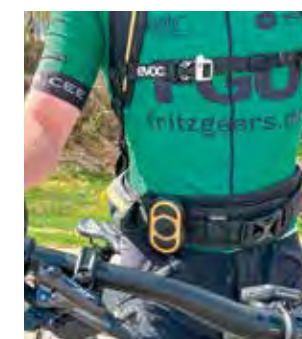
peicom Team mit Fritz Geers on Tour