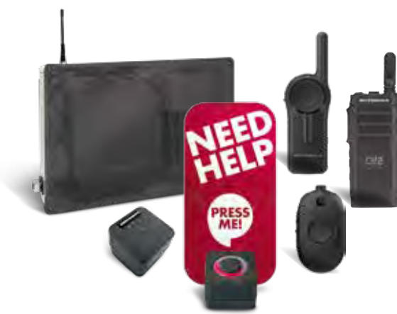
PTRadioBridge mit PTRB-Connect4, PTRB-Button und Funkgeräten